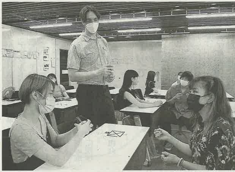
講座では、学生同士や英語圏出身の講師とトピックを決めて学ぶ(7月5日、川崎市多摩区で)